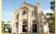
日本に現存する2番目に古いカトリック天主堂。