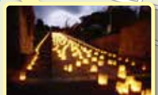
城下町宮津七万石和火。10月に開催され1万個の灯ろうで寺町をライトアップ。