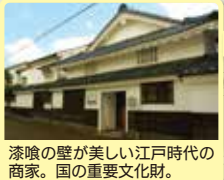
漆喰の壁が美しい江戸時代の商家。国の重要文化財。