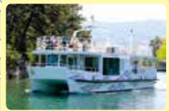
パーク&クルーズ 道の駅の駐車場に車を停めて、船で天橋立・伊根へ！4月頃～11月頃